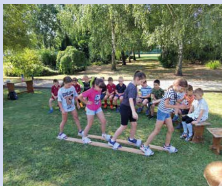
Ügyességi játék a hűs fák árnyékában