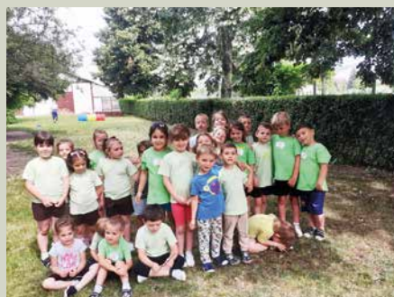
Dramajáték a Vidám Kalandok táborban