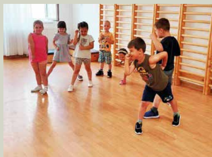
Évzáró mozgás az Őzike csoportban