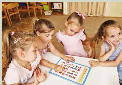
Nyári kalandok tábor – anyanyelvi fejlesztés