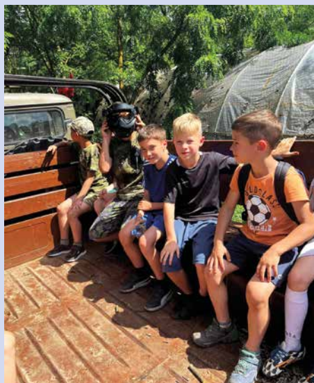
Buckó Paintball katonai teherautózás