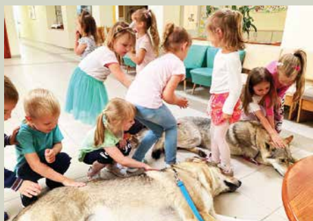
Argos Kutyaiskola bemutatója