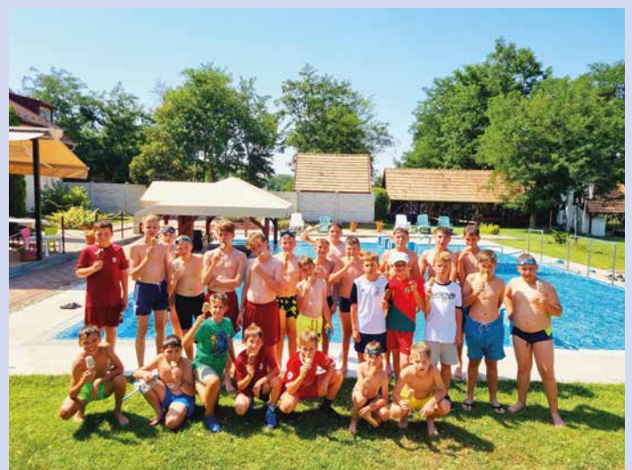
Strandolás és jégkrémezés a Liza Hotelban