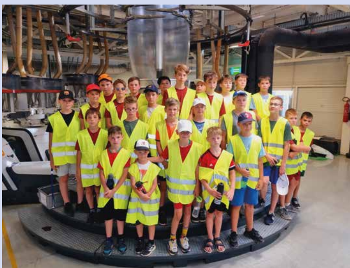
Üzemlátogatás a Lajosmizsei Folplast Kft.-nél