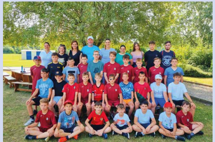
2024-es év 2. csoportja