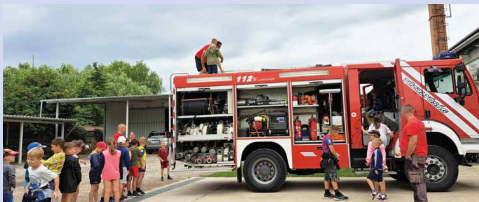
Látogatás a lajosmizsei Tűzoltó Parancsnokságon

facebook: www.facebook.com/egeszseghaz.lajosmizse • Honlap: www.egeszseghazlm.hu • e-mail: egeszseghaz@egeszseghazlm.hu