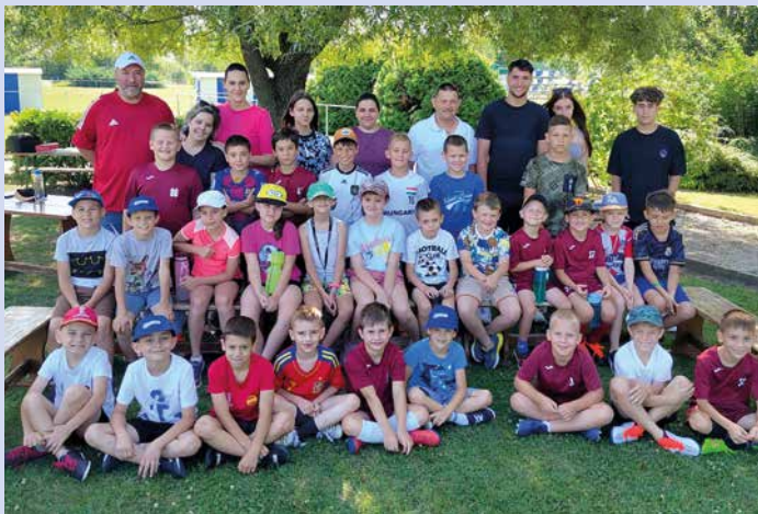
2024-es év 1. csoportja