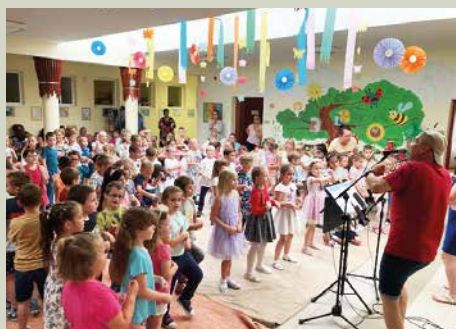
Búcsúzás a nagycsoportosoktól a Csiga Duó Zenekarral