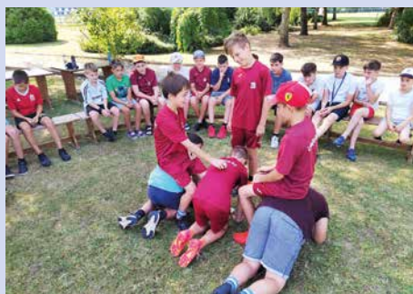
Activity sport témában