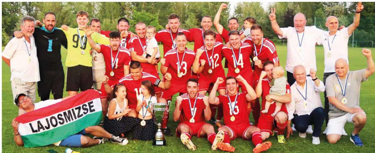
A kupagyőztes mizsei csapat.

Árva Zsolt együttese a bajnokságban is jól szerepelt, az 5. helyen végzett a 15 csapatos mezőnyben.