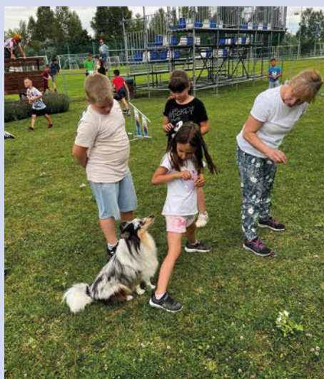
Interaktív kutyás bemutató a FreeFarm SE közreműködésével