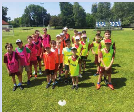
Indulhat a focibajnokság